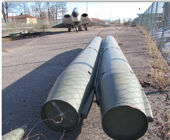
Två av flera robotar av modell Hawk har anlänt till museet.