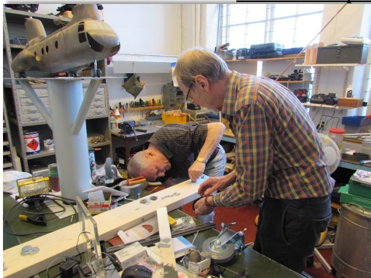
Mer arbete med hjulbyte nu på stativet till STVC3.